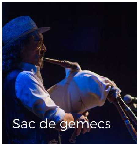
Sac de gemecs