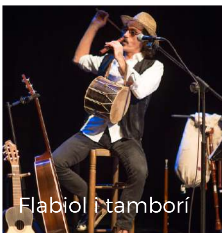
Flabiol i tamborí